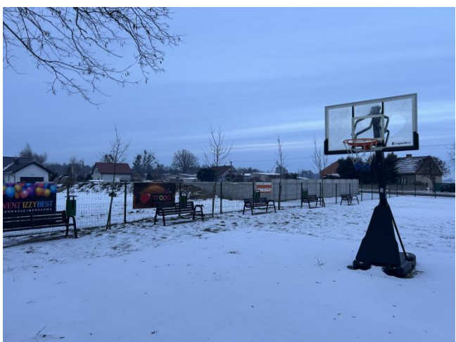
Boisko do gry w kosza przy świątelnicy wiejskiej w Konarzycach