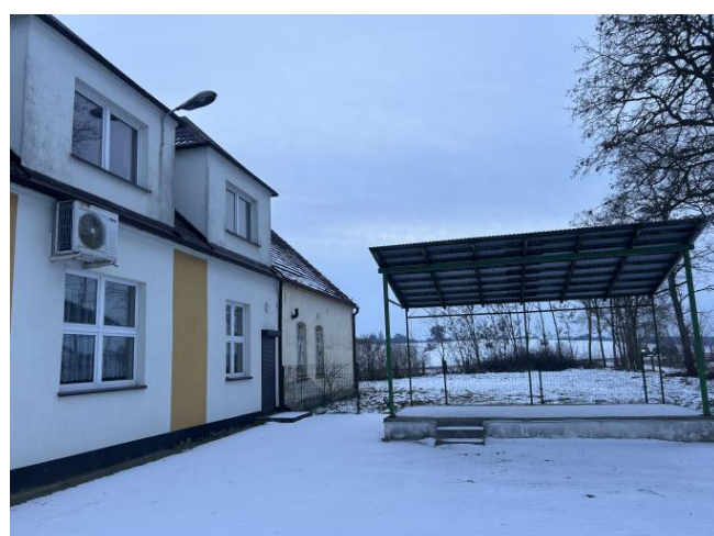
Scena plenerowa przy świątelnicy wiejskiej w Konarzycach