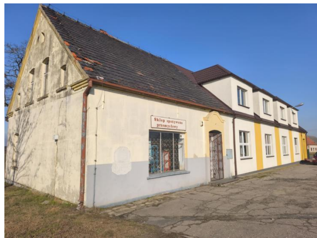
Nieżytkowany sklep przemysłowy w Konarzycach