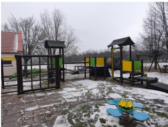
Plac zabaw przy Szkole Podstawowej w Konarzycach