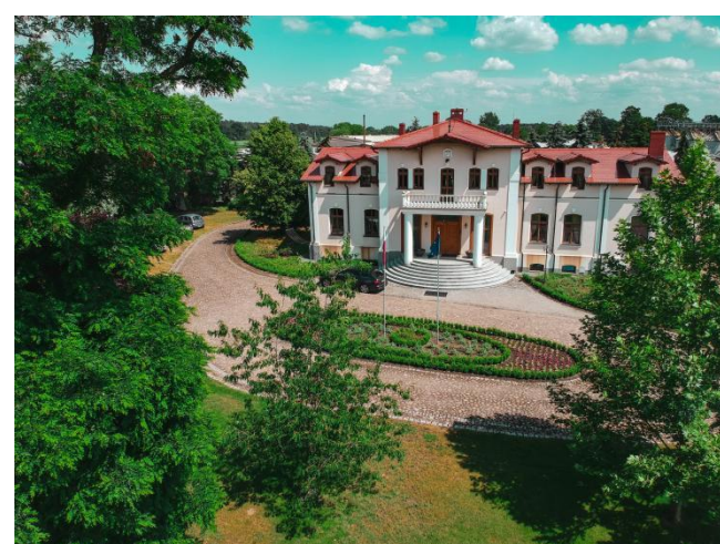
Dwór z I poł. XIX w. w Zaworach