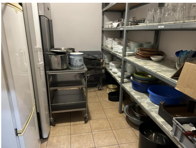
Wyposażenie kuchni w świetlicy wiejskiej