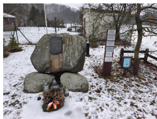
Obelisk poświęcony Maksymilianowi Cygalskiemu w Zaworach