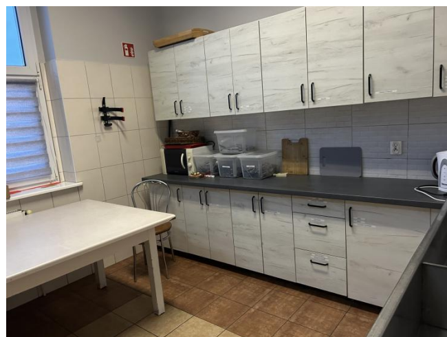
Kuchnia w świetlicy wiejskiej