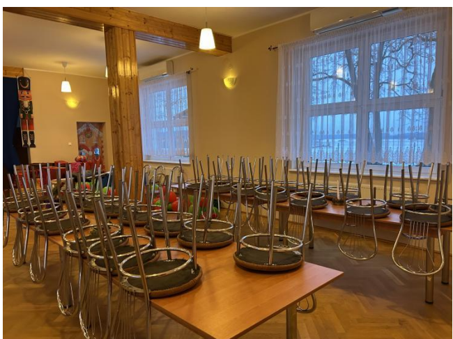
Wnętrze świątelnicy wiejskiej w Konarzycach