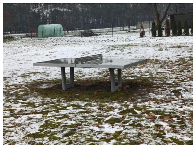
Stół do ping ponga przy Szkole Podstawowej w Konarzycach