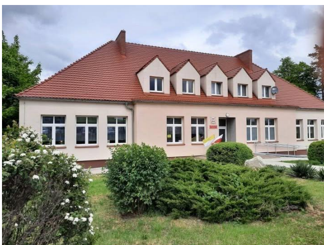
Szkoła Podstawowa w Konarzycach