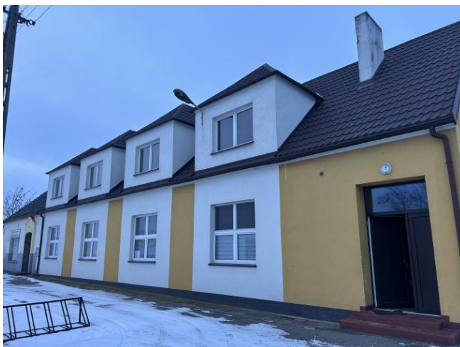
Świątelnia wiejska w Konarzycach

Z przeprowadzonej wizji w terenie sporządzono dokumentację fotograficzną.