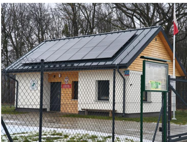
Siedziba Lasów Państwowych w Zaworach