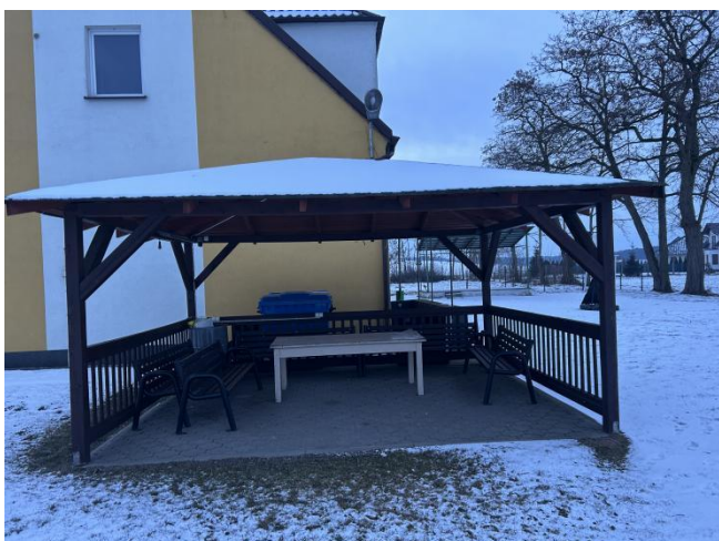
Wiata drewniana przy świątelnicy wiejskiej w Konarzycach