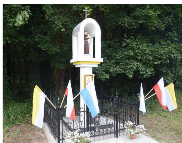
Figura św. Antoniego w Zaworach