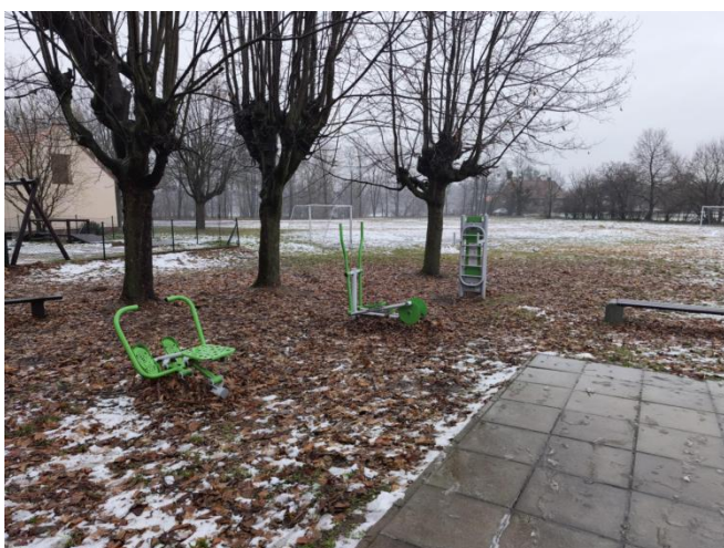
Siłownia zewnętrzna przy Szkole Podstawowej w Konarzycach