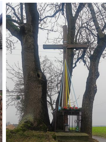
Miejsca kultu religijne