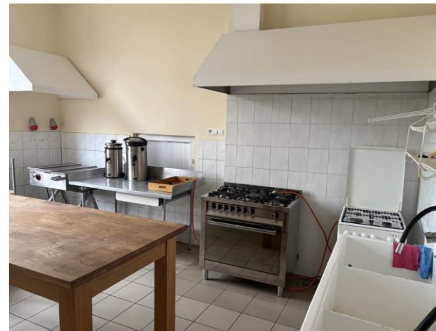
Zaplecze kuchenne w sali wiejskiej