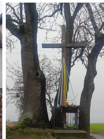
Miejsca kultu religijne