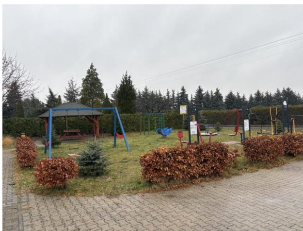
Teren rekreacyjny przy sali wiejskiej